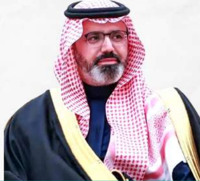
صاحب السمو الملكي الأمير / ناصر بن محمد بن عبدالله بن جلوي آل سعود نائب أمير منطقة جازان