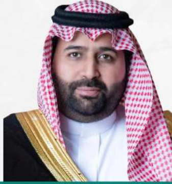
صاحب السمو الملكي الأمير / محمد بن عبدالعزيز بن محمد بن عبدالعزيز آل سعود أمير منطقة جازان