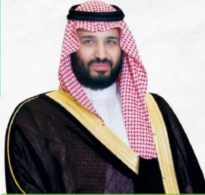
صاحب السمو الملكي ولي العهد الأمير / محمد بن سلمان بن عبدالعزيز آل سعود