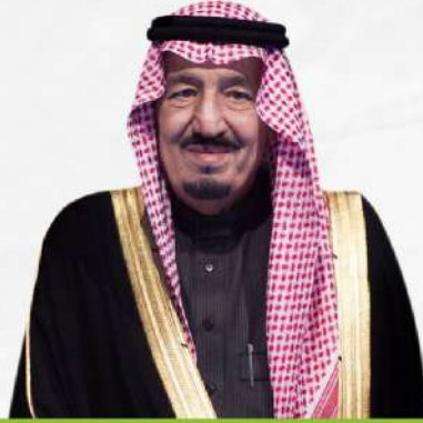
خادم الحرمين الشريفين الملك / سلمان بن عبدالعزيز آل سعود